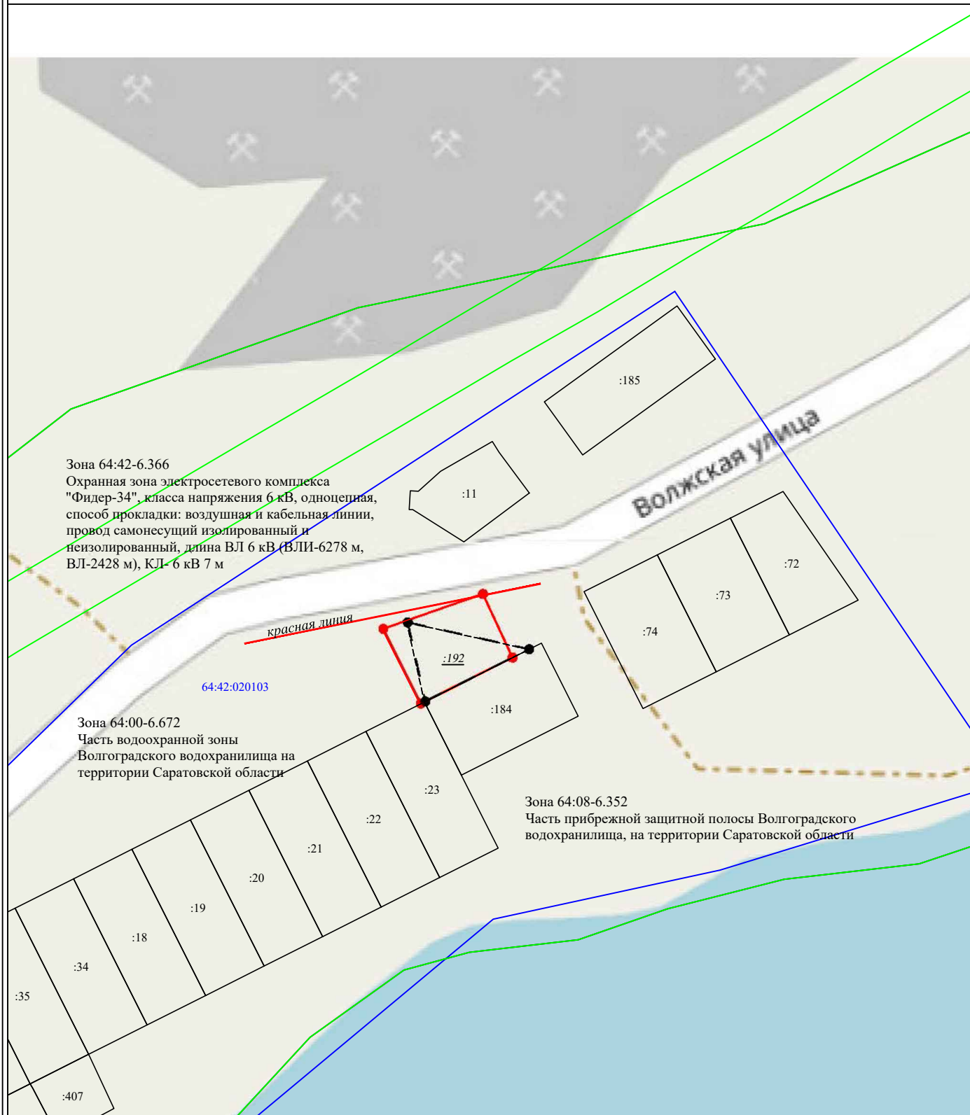
Схема расположения на кадастровом плане территории